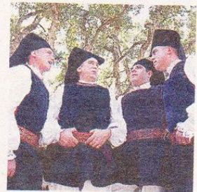
VOCI I Tenores di Bitti

Subito dopo, sul palco di Soleto arriveranno anche le danze e i canti degli Arakne Mediterranea, la compagnia fondata da