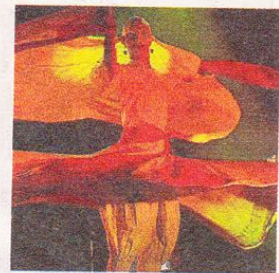
PIZZICA Gli Arakne